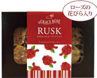
ローズの花びら入り