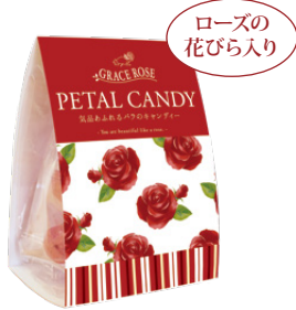
ローズの花びら入り