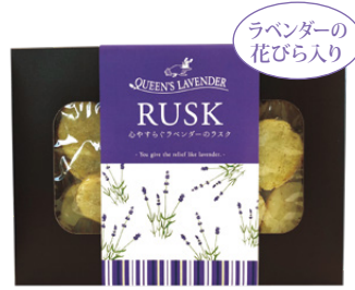
ラベンダーの花びら入り