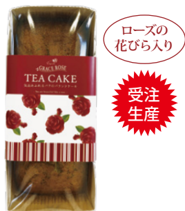
ローズの花びら入り