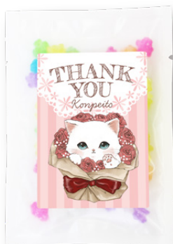
サンキューギフト(しろねこ) こんぺいとう