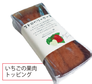
いちごの果肉 トッピング