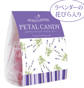
ラベンダーの花びら入り