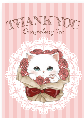
サンキューギフト(しろねこ) ダーズリン紅茶