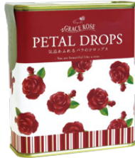
ローズの花びら入り