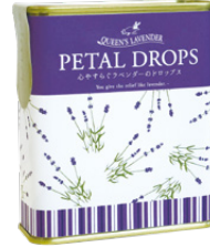
ラベンダーの花びら入り