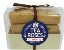
ティーローズクッキー クランベリー