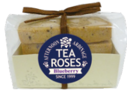
ティーローズクッキー ブルーベリー