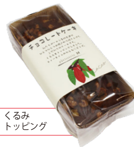
くるみ トッピング