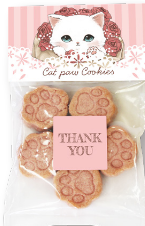
サンキューギフト(しろねこ) にくきゅうクッキー