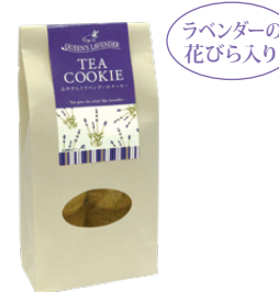
ラベンダーの花びら入り