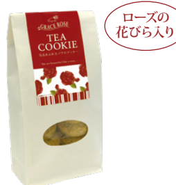
ローズの花びら入り