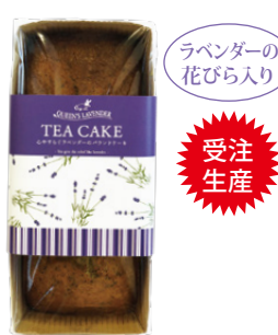
ラベンダーの花びら入り